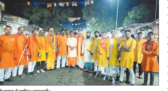
शोभायात्रा में शामिल नगरवासी।

परशुराम जन्मोत्सव पर पामगढ़ में भव्य शोभायात्रा निकली गई। शोभायात्रा के समापन के पश्चात विद्या निकेतन विद्यालय परिसर में विधिवत पूजन और महाआरती संपन्न हुई।