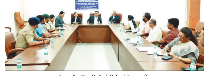
बैठक में अधिकारियों को निर्देश देते न्यायाधीश।

आगामी नेशनल लोक अदालत 9 मई को लगाई जाएगी। लोक अदालत की तैयारियों को लेकर बैठक की गई। बैठक में नेशनल लोक अदालत को सफल बनाने जिला प्रशासन के विभिन्न विभाग के अधिकारियों को निर्देशित किया गया।