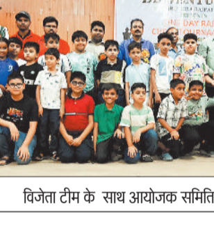
विजेता टीम के साथ आयोजक समिति के पदाधिकारी।